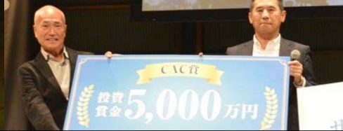
CAC賞 投資賞金5000万円を獲得したメビオール