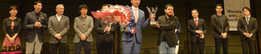
日本代表 Seven Dreamers Laboratories