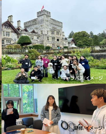
キャンパスイメージ