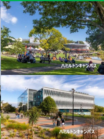
ハミルトンキャンパス