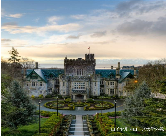
ロイヤル・ローズ大学外観