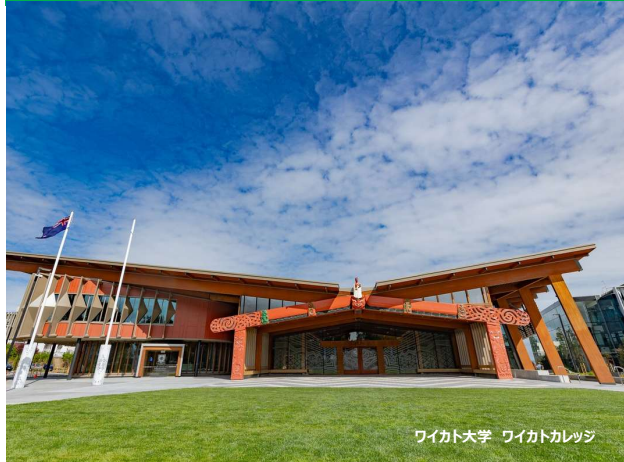
ワイカト大学 ワイカトカレッジ