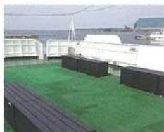
■甲板 可欣賞絕景的廣闊甲板。