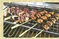
■濱燒 (烤章魚或貝類等)