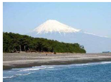
世界遺產富士山的 構成資產「三保松原」

＜上午＞ 國寶 松本城 移動:長野縣⇒靜岡市 ＜下午＞靜岡市觀光 參觀三保松原 參觀三保水族館 ＜住宿＞旅館(靜岡市內)