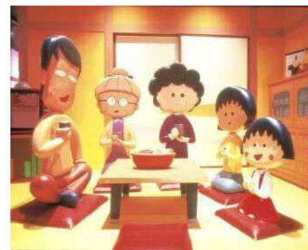
櫻桃小丸子博物館