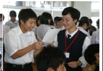
學校交流是最好的回憶！