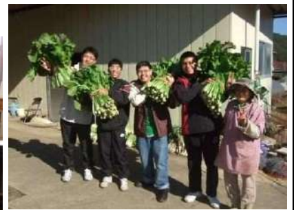
日本農村生活體驗