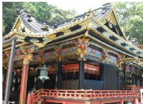
曆史體驗 (國寶 久能山東照宮)