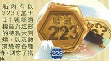
■富士見燒 (冬季限定)