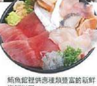
鮎魚館裡供應種類豐富的新鮮海鮮料理。