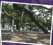
富士山世界遺產 構成資產「三保松原」