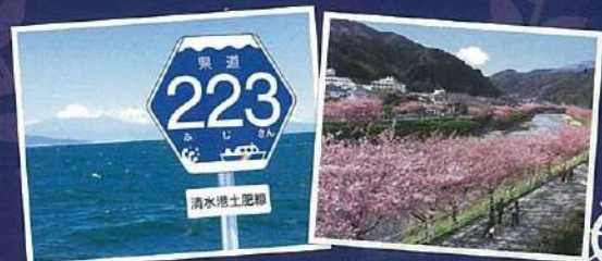
由甲板望見的富士山與223標誌 伊豆「河津櫻」(2/10~3/10)