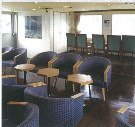
■特別客艙 (OCEAN ROOM) 座位寬敞的沙發讓您享受舒適的旅程。