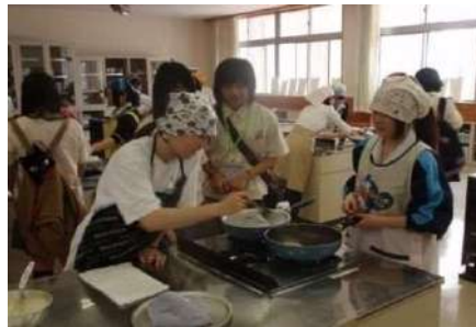
與日本學生協力做日本料理

＜上午＞學校交流 (上課・活動體驗等) ＜下午＞農村體驗 ＜住宿＞寄宿農家家庭 (長野縣內)