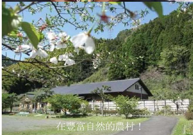
在豐富自然的農村！