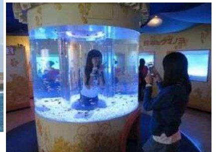
像自己在水槽裡的感覺！