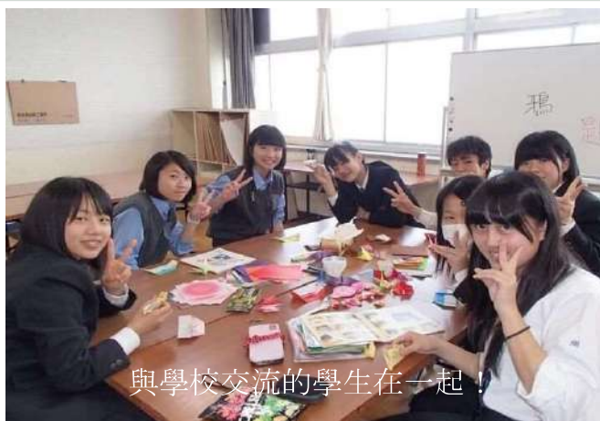
與學校交流的學生在一起！