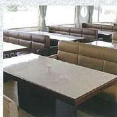
■客艙 備有桌子及長沙發的客艙。